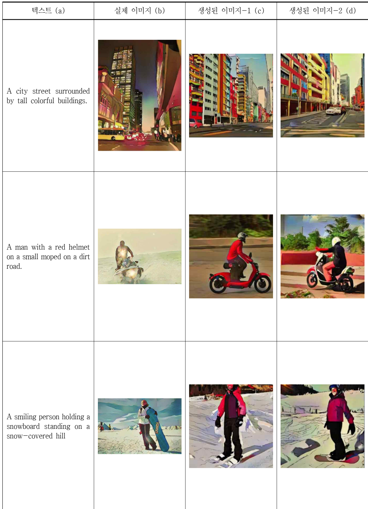
그림 3. 미세 조정된 Stable Diffusion을 이용한 웹툰 생성