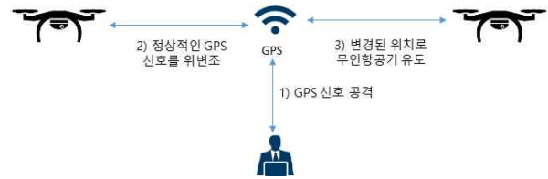
그림 1. GPS 스푸핑(Spoofing) 공격

수 있다. 아래 그림 1과 같이 해커에 의해 GPS를 신호를 위·변조하여 원하는 장소로 유도하여 불법으로 탈취가 가능하다.[1]