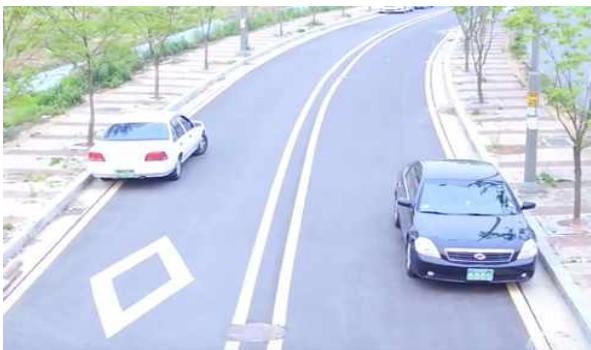
그림 3. 무인항공기를 활용한 개인 차량 정보 촬영[9]

아래 그림 3 에서와 같이 무인항공기를 이용한 차량 번호 불법 촬영으로 이를 통한 자동차 위치추적, 사용자 이동경로 등 개인정보의 불법 촬영 및 이러한 정보의 제3자에게 전달/활용되어 개인에게 불필요한 접근이 가능하며, 이에 대한 운전자의 피해가 증가 될 수 있다.[5]