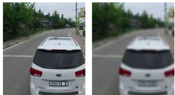
그림 7. Gaussian filters를 활용한 정보보호

아래 그림 7과 같이 실험해 본 결과 무인항공기로 촬영한 이미지가 가우시안 필터를 활용하여 보호되는 것을 확인 할 수 있었다. 가우시안 필터는 노이즈를 어느 정도 제거했지만, 엷지도 둔화시켰다.