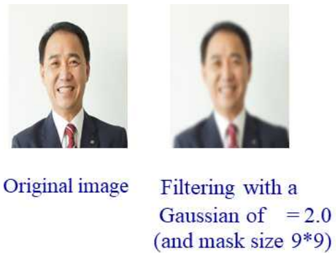
그림 5. Gaussian filters 적용[12][13]

그림 5에서와 같이 가우시안 필터(Gaussian filters)를 사용하여 영상정보를 보호한다. 즉, 2차원 가우시안 분포는 중앙에 위치한 기준 화소를 중심으로 이웃한 좌우측의 화소의 거리가 멀어질수록 적은 가중치를 부여 이미지의 잡음을 제거하여 마스킹의 폭을 결정한다. 또한, 가우시안 필터(Gaussian filters)는 현재 픽셀값과 주변 이웃 픽셀값들의 가중 평균(weighted average)을 이용해서 현재 픽셀의 값을 대체한다. 현재 픽셀에서 가까울수록 더 큰 가중치를 갖고 멀수록 더 작은 가중치를 갖는다.