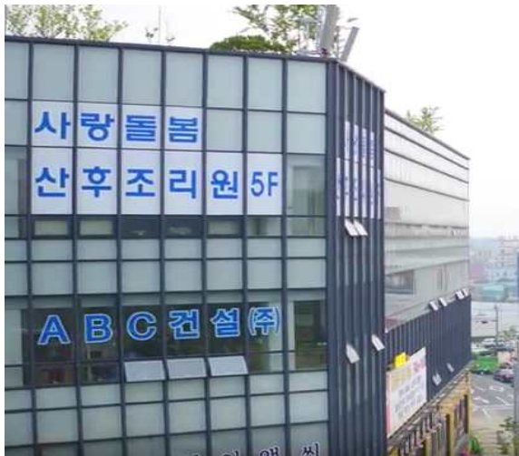
그림 2. 무인항공기를 활용한 건물 내외부 촬영[10]

무인항공기 카메라로 촬영된 영상은 현장→카메라→디지털 저장장치→인터넷망→서버→인터넷망→PC로 전송될 수 있다. 이에 1차적으로 개인영상정보를 습득한 이후 신속하게 저장 가능한 것이 특징이다. 나아가 무인항공기 카메라는 원격통신체계 (telecommunications system)를 기반으로 하여 기기와 기기 사이의 네트워크가 연결되기 때문에 쉽사리 정보가 이전될 수 있고, 소프트웨어에 따라 촬영된 인물이나 물체를 자동적으로 분석할 수도 있다.[7] 아래 그림 2에서 사전에 허가 받지 않는 무인항공기를 활용한 건물 내외부 촬영으로 사람의 움직임 및 상호, 위치정보 등 개인정보를 유추 할 수 있는 사례를 보여 주고 있다.