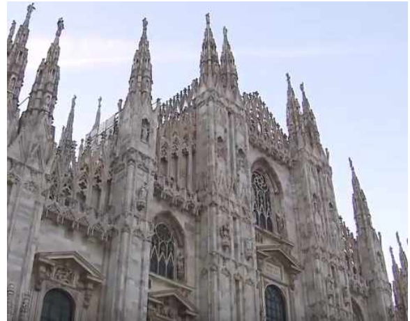
그림 4. 무인항공기를 허가 받지 않은 지역 촬영[11]

그림 4 에서와 같이 모 대기업이 당국의 허가 받지 않고 무인항공기를 활용한 드모루 성당 촬영으로 유적지 사진의 불법 유포, 사용, 비인가 영역의 불법 촬영으로 보안상의 이슈가 된 사례도 있다.